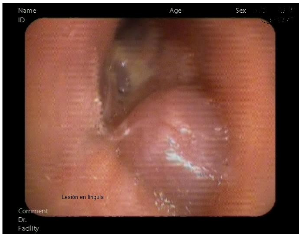
Figura 2. Broncoscopia en la que se aprecia una lesión en la língula que obstruye por completo la entrada del fibrobroncoscopio.