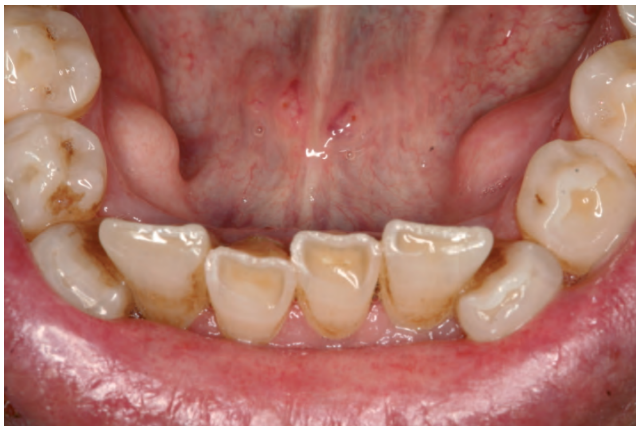
Figura 1. Exostosis bilateral en maxilar inferior (torus mandibular) a nivel sublingual. Facetas de desgaste en arcada dental inferior.

Aunque el torus ha sido mencionado en la literatura médica desde hace más de 180 años, sólo con los avances en el campo de la genética ha sido posible un mejor conocimiento del mismo en las últimas dos décadas. Su frecuencia varía en diferentes grupos étnicos y hoy se considera el resultado de la interacción de factores genéticos y ambientales con una presentación familiar que sugiere una herencia autonómica dominante de baja penetrancia.