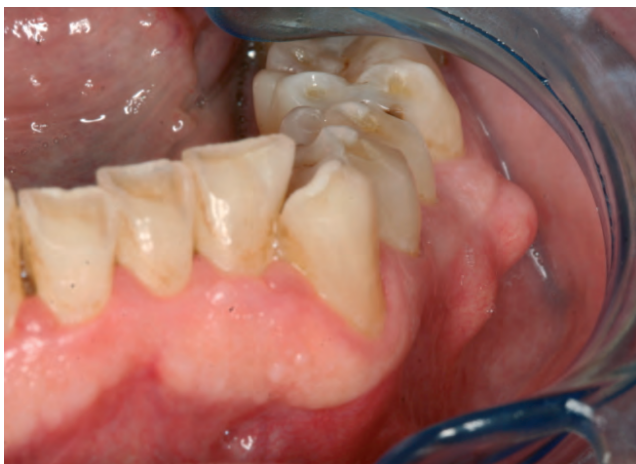
Figura 2. Imagen del torus mandibular a nivel vestibular.

El torus mandibular es, junto al torus palatino, la exostosis intraoral más común. La prevalencia varía entre el 6 y el 40%. La frecuencia y el tamaño aumentan con la edad, siendo raros antes de los 10 años. En la radiografía no se aprecia el torus cuando es menor de 4 mm. Predomina en forma simétrica en el 80% de los casos, pero cuando es unilateral se encuentra mayormente en el lado derecho.